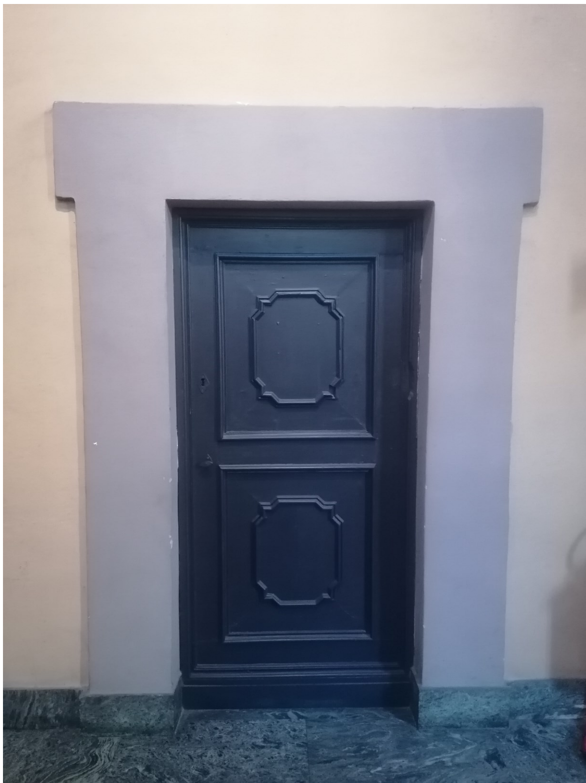
Titolo foto: A1