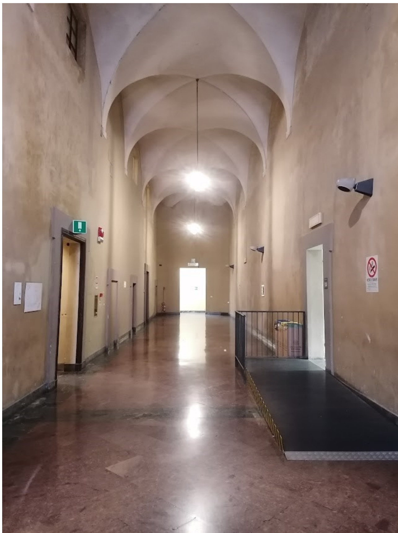
Sezione di corridoio est dove verranno ubicate le teche con reperti paleontologici