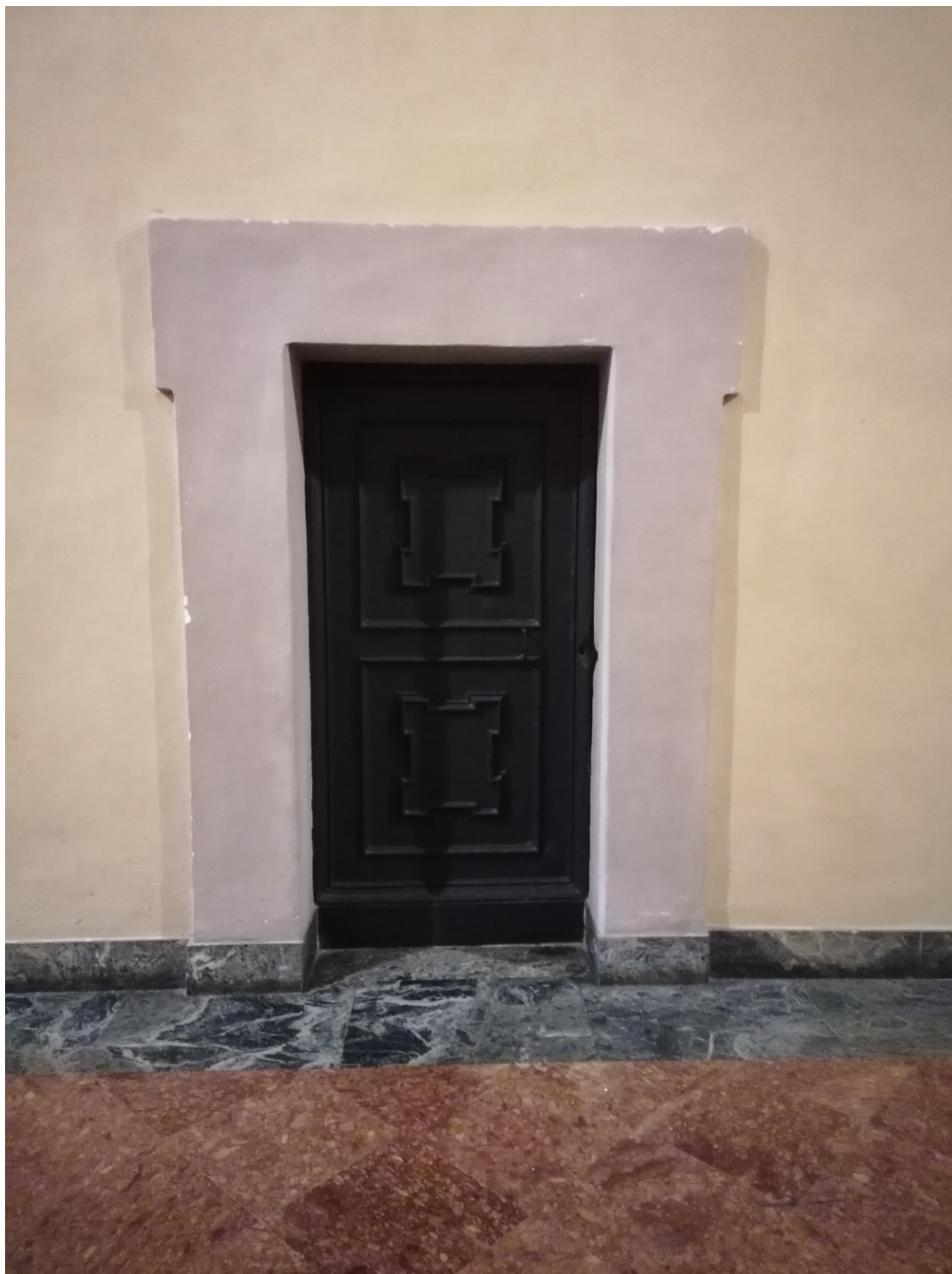
Titolo foto: C