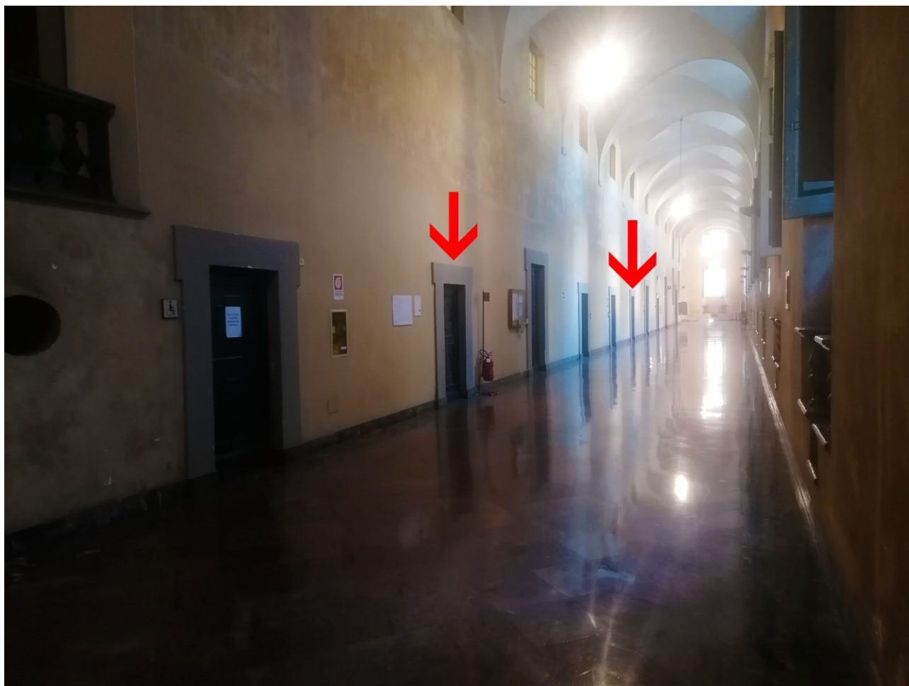
Titolo foto: Corridoio Ovest