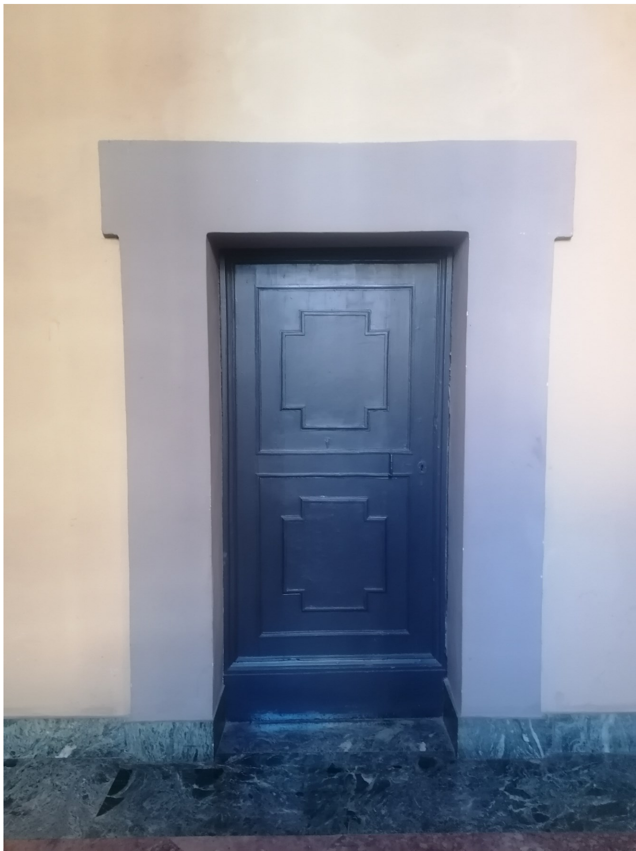
Titolo foto: A2