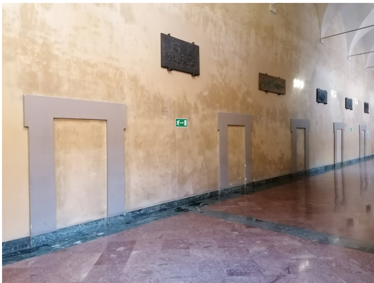
Titolo foto: B