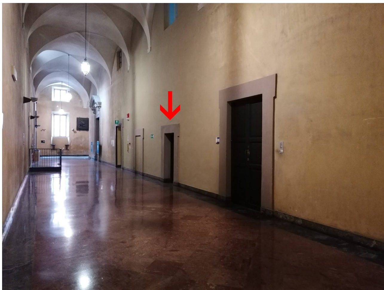
Titolo foto: Corridoio Est