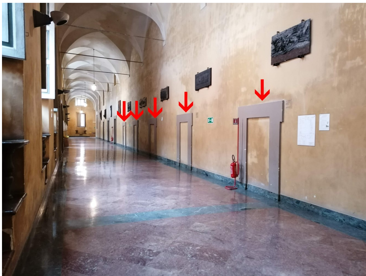
Titolo foto: Corridoio Sud